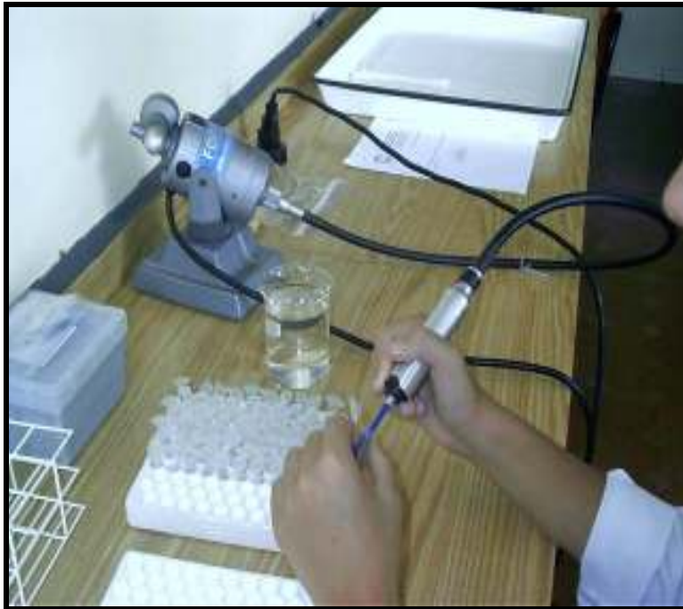
Figura 6: Trituração dos insetos a serem empregados no teste ELISA