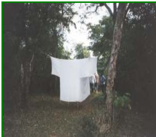
Figura 2: Armadilha de Shannon utilizada para captura dos insetos