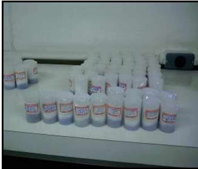
Figura 4: Acondicionamento dos insetos em sílica gel para posterior utilização no teste ELISA para verificação de Hábito Alimentar.