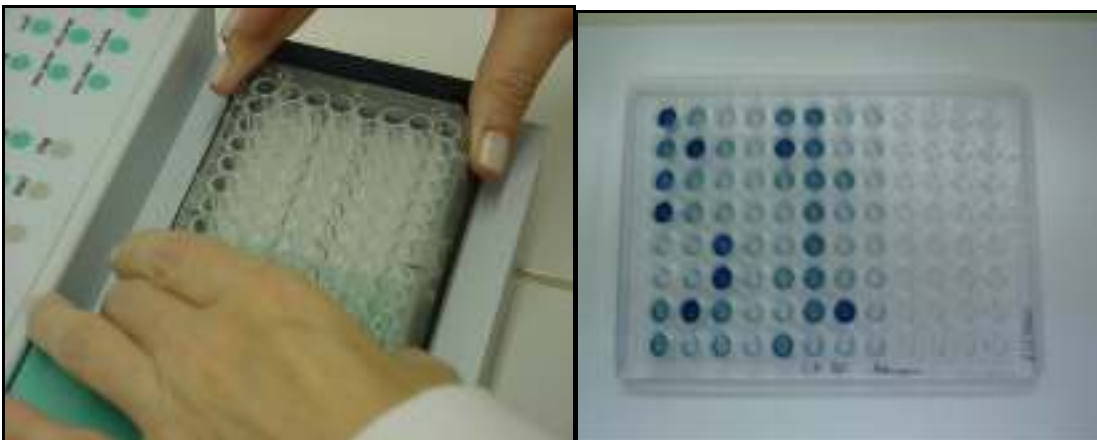
Figura 9 e 10 Leitura do teste imunoenzimático ELISA indireto para pesquisa de Hábito Alimentar